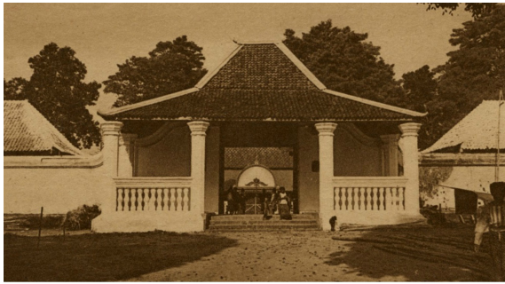
Masjid Gedhe Kauman tahun 1910