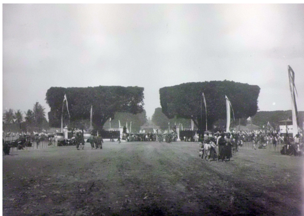
Alun-Alun Utara tahun 1888 (Knaap, 1999:42)

Panggung Krapyak juga merupakan salah satu bangunan yang berada pada sumbu filosofis utara – selatan dengan Kraton sebagai pusatnya. Dalam sumbu filosofis itu adalah Panggung Krapyak – Kraton – Tugu Pal Putih. Panggung Krapyak merupakan simpul yang berada selatan dan jika diteruskan ke selatan akan sampai ke Pantai Selatan Samudera Hindia. Dari Tugu Pal Putih jika diteruskan ke utara akan sampai ke Gunung Merapi. Sumbu filosofis itu mengandung arti manunggaling kawula gusti atau bersatunya rakyat dengan rajanya. Dari sudut agama Islam, sumbu filosofis itu mengandung makna konsep hubungan antara manusia dengan Tuhan dan konsep hubungan antara manusia dengan sesamanya. Tempat-tempat dalam satu sumbu filosofis itu merupakan lokasi-lokasi penting dalam struktur kebudayaan Kraton dan masyarakat. Dari jalur itulah awal pertumbuhan Kota Yogyakarta dan kemudian berkembang ke arah timur barat tatkala jaringan transportasi dan infrastruktur pendukung lainnya berkembang.