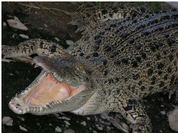
Gambar 3. Crocodylus porosus (buaya muara)