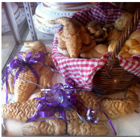
Gambar 2. Roti buaya

Roti buaya tidak boleh dimakan, para tamu yang hadir pun tidak diperbolehkan mengambil roti tersebut, jika diambil akan mendatangkan bala (Dinas Pariwisata & Kebudayaan Prov DKI JAKARTA, 2018). Roti buaya yang disajikan terdiri dari bentuk yang besar dan kecil. Roti digunakan sebagai simbol harapan bahwa rumah tangga menjadi tangguh dan mampu bertahan hidup di mana saja layaknya buaya. Keberadaan roti buaya dalam upacara pernikahan menjadi sebuah mitos adanya pertanda baik untuk pernikahan. Roti buaya juga merupakan penghormatan terhadap roh siluman buaya putih yang berwujud dalam roti buaya.