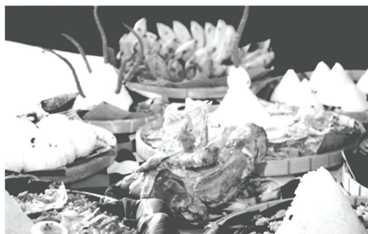
Gambar 1. Sebagian dari sajèn ruwatan

Berikut contoh sebagian sesajian ruwatan lakon Sudhamala .