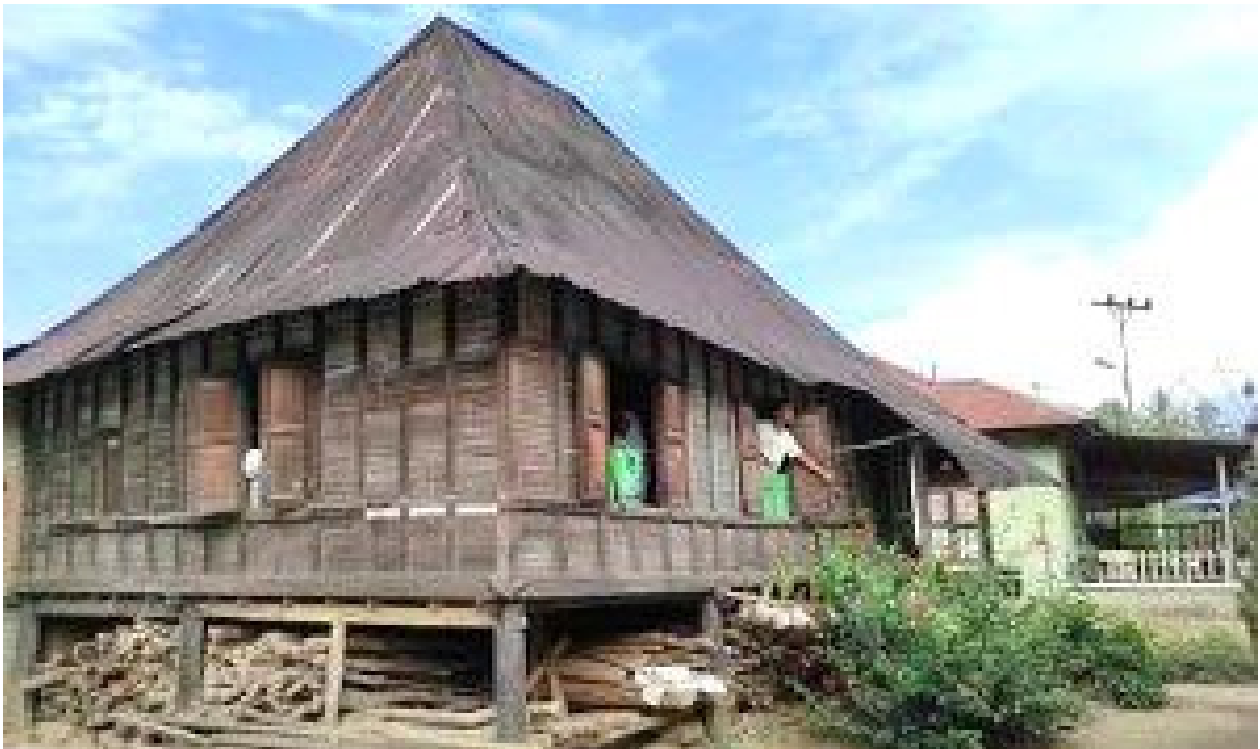
Gambar 1. Bagas Podoman Tempat Anak Gadis Tidur di Malam Hari

Penataan rumah ini tentu saja tidak terlepas dari sistem sosial Dalihan Natolu yang terdiri atas Mora , Kahanggi dan Anak Boru yang disesuaikan dengan tradisi, budaya dan teknologi yang berkembang dalam masyarakat (Fitri, dkk., 2000). Dalihan Natolu berarti tiga tiang (kaki) tungku yang dijadikan kaki tempat memasak makanan. Dalihan Natolu menjadi sumber inspirasi dalam Suku Batak dan menjadi falsafah (filsafat) yang mengatur seluruh sistem kekerabatan, sistem kebudayaan, dan tata kehidupan Etnis Mandailing (Adlina, 2020). Berikut adalah gambar rumah tradisional Etnis Mandailing.