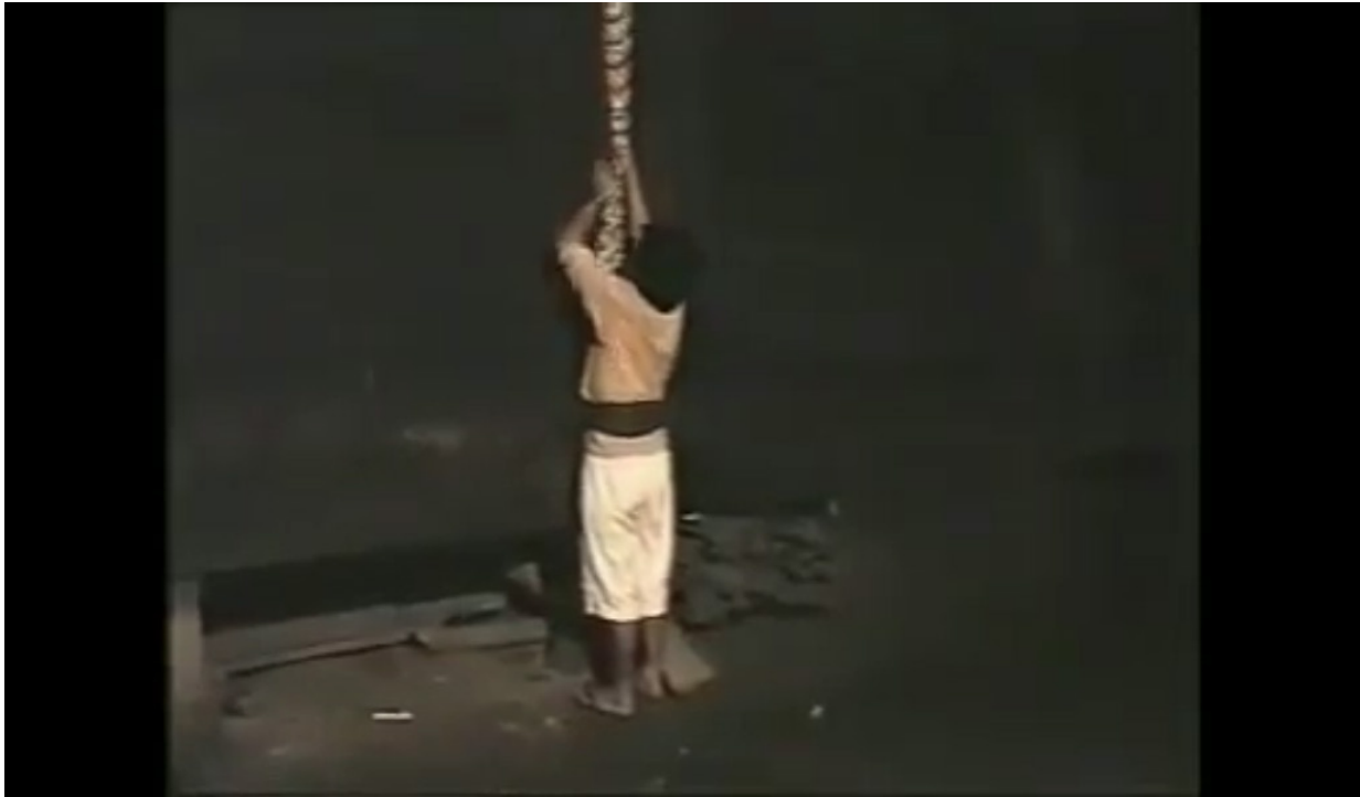
Gambar 6. Pemuda yang berada di luar rumah menerima kain pemberian gadis yang berada di dalam rumah

Bisanya kegiatan markusip akan berakhir ketika sudah masuk waktu subuh. Sebelum pukul empat pagi, si pemuda akan memberitahu anak gadis yang bersangkutan untuk mengakhiri kegiatan markusip dan pamit pulang ke rumahnya. Keesokan harinya pada waktu yang telah mereka sepakati, mereka akan saling bertemu walaupun hanya sebatas melirik satu sama lain dengan memakai kode baju yang telah disepakati sebelumnya. Dari sinilah keduanya, baik pemuda maupun anak gadis, akan saling melihat wajah satu sama lain. Setelah pertemuan singkat tersebut, keduanya kembali akan melakukan kegiatan markusip . Biasanya pada waktu inilah anak gadis memberikan keputusannya apakah akan menerima pemuda yang datang markusip atau tidak. Apabila si anak gadis merasa jatuh hati pada pemuda tersebut dari pertemuan secara langsung, maka ia akan menerimanya. Namun jika si anak gadis merasa biasa saja, maka ia akan menolaknya dengan cara yang halus.