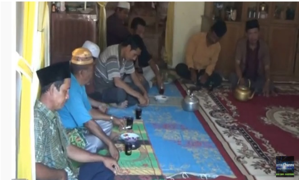
Gambar 7. Kegiatan manghobar boru dalam adat Mandailing dari pihak calon pengantin laki-laki

Selanjutnya pihak laki-laki akan melamar gadis tersebut secara resmi. Apabila pinangan telah diterima oleh pihak orang tua calon pengantin, selanjutnya dilakukanlah upacara penyerahan mas kawin yang dilakukan oleh kerabat calon pengantin laki-laki pada waktu yang disepakati kedua belah pihak. Selain mas kawin, barang hantaran lainnya yang diberikan di antaranya silua (oleh-oleh) dan batang boban (berupa barang berharga). Upacara penyerahan mas kawin dan musyawarah pernikahan dinamakan dengan manghobar boru atau manghobari boru (Lubis, 1998). Dalam kesempatan tersebut kedua keluarga juga akan sama-sama menyepakati kapan pesta pernikahan akan diselenggarakan. Berikut adalah pelaksanaan acara menghobar boru .