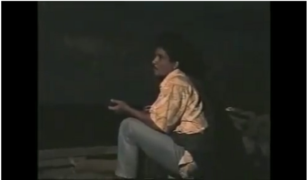
Gambar 2. Pemuda sedang melakukan markusip di kolong rumah

Dalam proses awal kegiatan markusip , biasanya ada dua tahapan yang dilakukan oleh seorang pemuda. Pertama ialah marngoti boru bujing (membangunkan si anak gadis yang sedang tidur) untuk diajak berdialog dan yang kedua adalah mengelek boru bujing (membujuk anak gadis) untuk berdialog ketika ia sudah bangun. Di bawah ini adalah gambar prosesi kegiatan markusip muda dan mudi Mandailing tempo dulu.