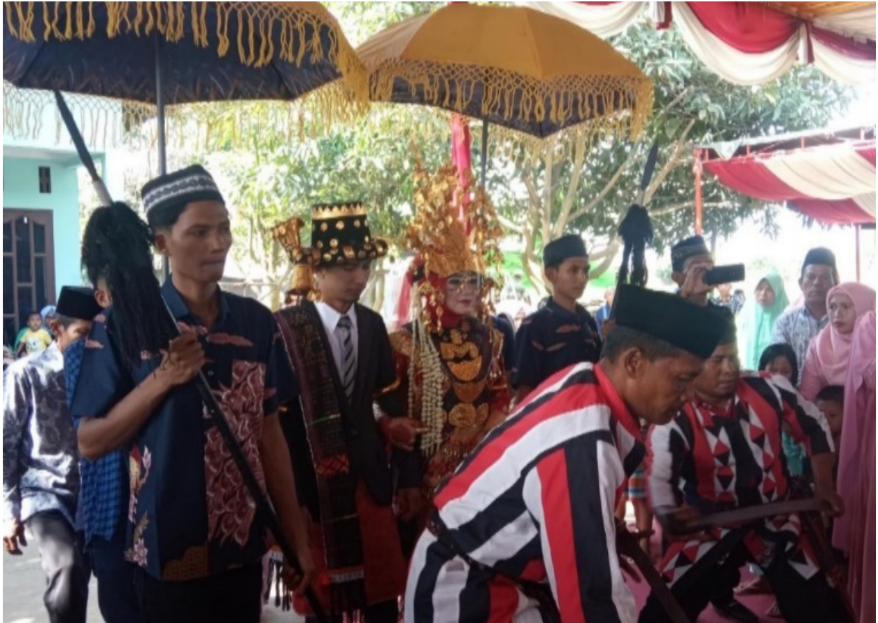
Gambar 8. Calon pengantin menuju kediaman pengantin laki-laki