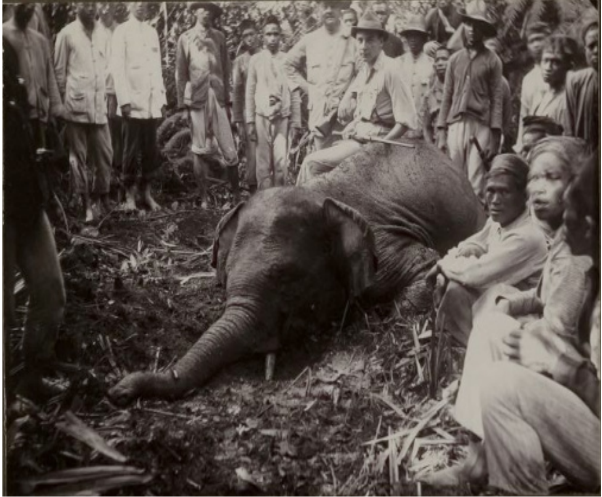
Gambar 7. Perburuan gajah di Simalungun sekitar tahun 1920