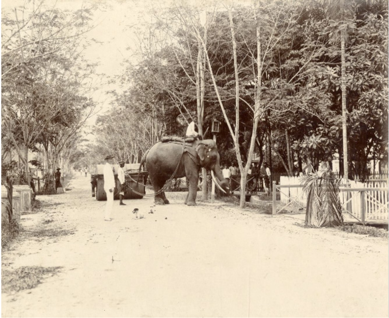
Gambar 5. Pekerja jalan di Langkat yang menaiki gajah tahun 1925