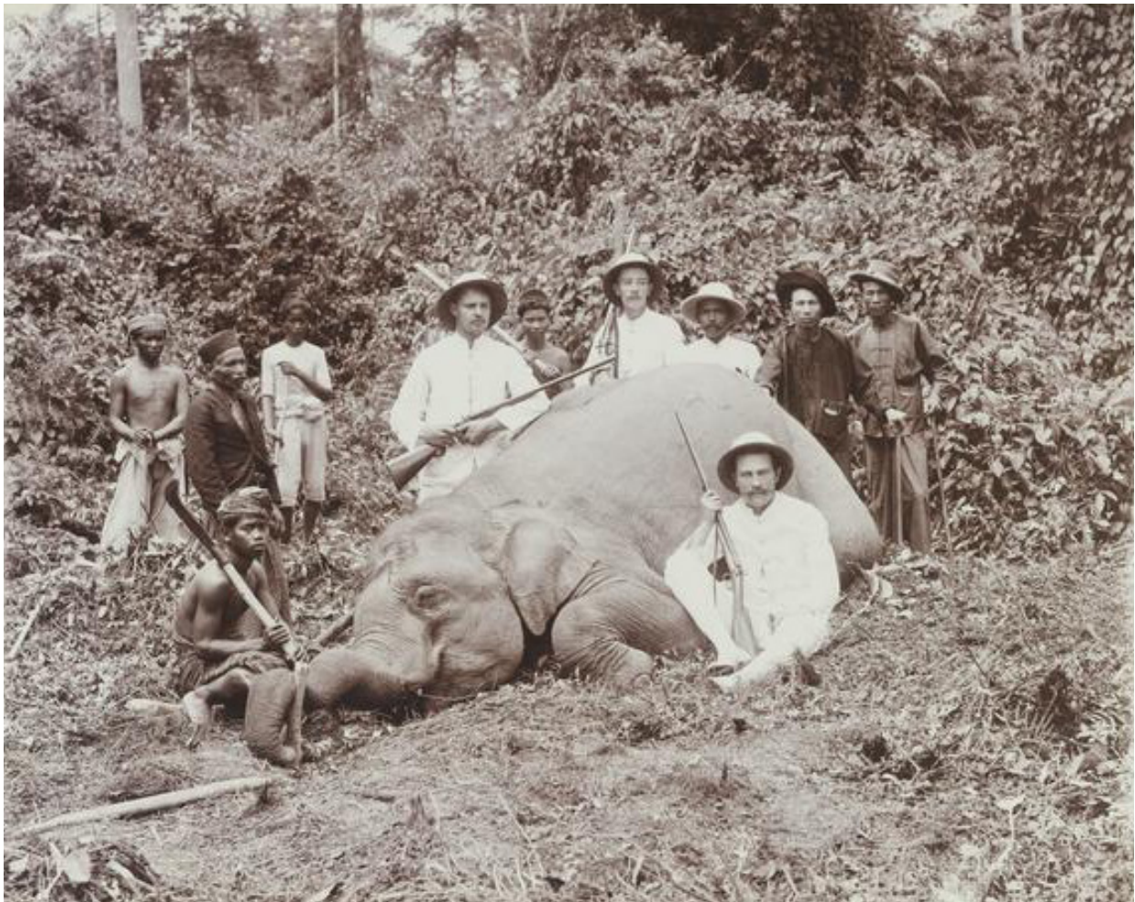
Gambar 6. Pemburu gajah di wilayah hutan di perkebunan Deli tahun 1905

Berburu adalah aktifitas yang sudah dilakukan manusia sejak masa praaksara dan terus berlangsung hingga masa kerajaan di Nusantara. Peter Boomgard (1997) menyebutkan bahwa setiap kerajaan yang ada di Nusantara memiliki tempat berburu khusus. Perburuan dilakukan terhadap rusa, burung, harimau, badak, hingga gajah. Berburu juga menjadi aktifitas yang dijadikan hobi bagi sebagian orang Eropa selama berada di wilayah Hindia Belanda, karena hutan-hutan yang ada di Jawa, Kalimantan (Borneo) dan Sumatera memiliki fauna yang sangat beragam (Stroomberg & Apriyono, 2018). Aktivitas perburuan ini terutama terjadi di wilayah perkebunan, termasuk perkebunan di Sumatra Timur. Karena berburu hanya dilakukan sebagai hobi, kegiatan ini dilakukan oleh kalangan terbatas, seperti personel militer, pejabat kehutanan, staf perkebunan, dan turis Amerika dan Inggris yang sengaja datang ke Sumatera Timur untuk berburu di hutan dekat perkebunan (Peter Boomgard, 2001).