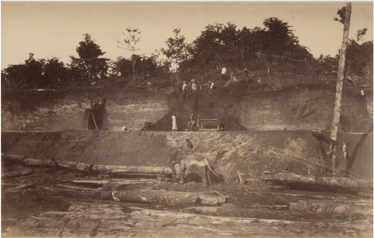
Gambar 2. Gajah dan pembukaan lahan perkebunan di Langkat 1890

ternak atau orang itu sendiri yang disergap oleh macan dan harimau. Terlebih lagi pada wilayah Langkat yang membentang dari pesisir hingga Bukit Barisan.