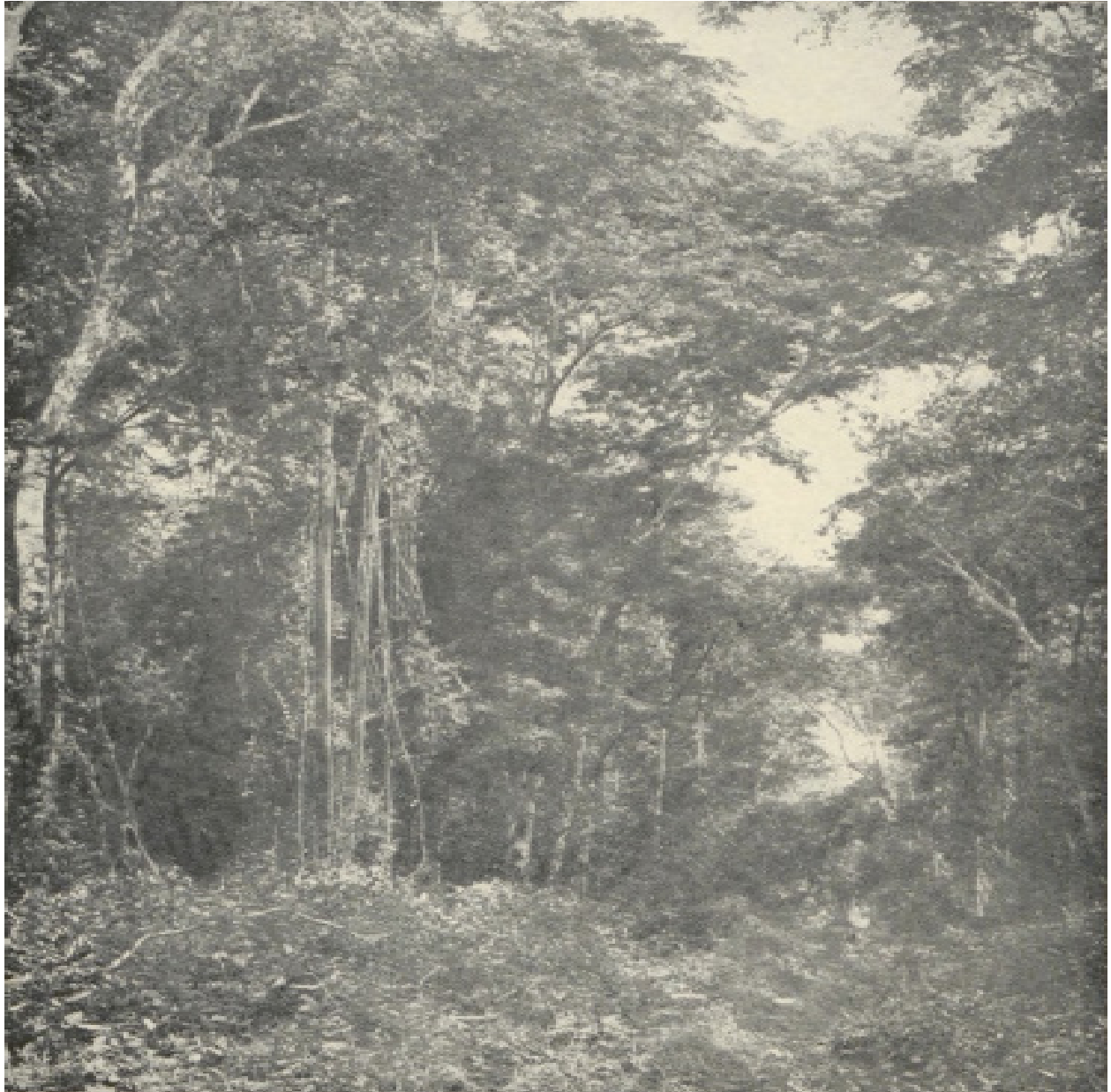
Gambar 1. Hutan purba Sumatra

dan mengklaim bahwa merekalah yang paling berkontribusi dalam merobohkan hutan purba di Sumatra Timur dan mengubahnya menjadi jaringan kereta api, jalan raya, bangunan-bangunan perkantoran, dan kota di tengah-tengah hamparan perkebunan tembakau yang mereka bangun (“Uit Den Pionierstijd van Deli [From the Pioneer Time of Deli],” 1938).