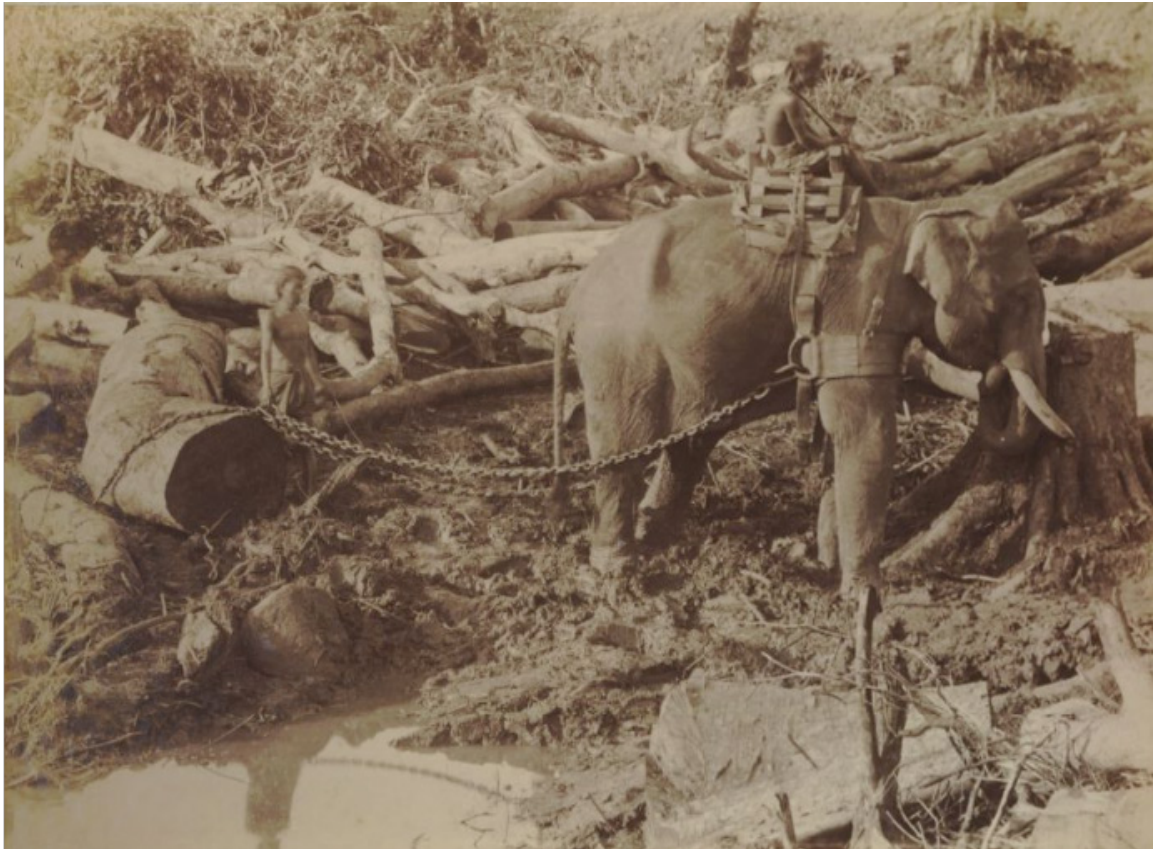
Gambar 3. Gajah dan Pembukaan lahan Perkebunan di Langkat 1890