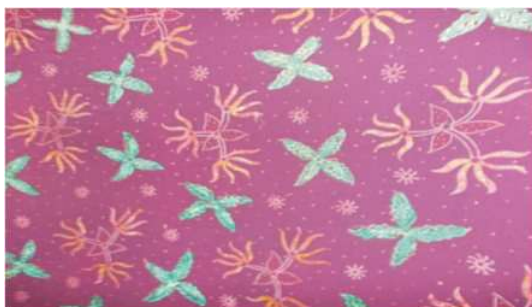
Foto 1 : Batik Kenongo motif Bunga Kenanga

batik kenongo ini sebenarnya tergolong bagus dan cantik, hanya saja motif yang minim dan potensi desainnya masih kurang beragam sehingga belum mampu bersaing dengan batik khas Jawa Tengah yang sedang populer. 1