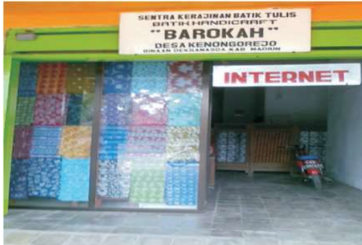
Foto 4 : Salah satu home industry Batik Kenongo

Di tahun 2009, produksi Batik Kenongo mengalami kenaikan. Marfu'ah yang merupakan salah satu warga Desa Kenongorejo mengungkapkan bahwa pada tahun 2009 kain batik mulai eksis setelah resmi menjadi milik bangsa Indonesia. Banyak kain batik yang dijadikan sebagai keperluan rumah tangga. Selain itu, industri-industri rumah tangga Batik Kenongo juga mulai sibuk mengerjakan pesanan batik yang semakin bertambah saat itu. 12