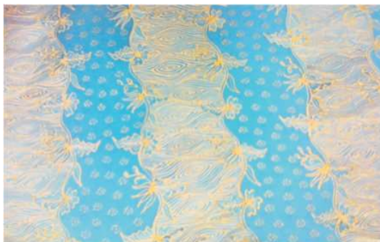
Foto 2 : Motif Serat Jati dan motif Gabah Sinawur

Pada tahun 1920-1930-an kegiatan pematikan berjalan dengan para buruh batik sebagai pelaku sejarahnya. Rata-rata pada tahun tersebut, penduduk Desa Kenongorejo bermata pencaharian sebagai buruh tani dan buruh batik. Meskipun belum berdiri sebagai industri yang tergolong modern, namun beberapa pengusaha kecil sudah menekuni pematikan secara turun temurun. Saat itu pematikan masih berupa kain batik setengah jadi/batik mentah. Kemudian finishing akan dilakukan di Ponorogo dan Tulungagung. Dahulu kain batik berupa kain panjang dan ikat kepala masih banyak digunakan oleh penduduk di berbagai daerah. 3