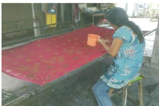
Foto 3 : Buruh wanita melakukan pewarnaan pada kain batik

Pada tahun 2009, UNESCO menetapkan batik Indonesia sebagai mahakarya warisan budaya Indonesia. Hal ini disambut antusias dan bahagia oleh seluruh lapisan masyarakat Indonesia. Seiring berjalannya waktu dan didukung adanya pengakuan dunia tentang batik Indonesia, kegiatan batik di berbagai daerah mulai bangkit. Batik digunakan secara luas di berbagai kalangan. Setiap hari Jum'at di lingkungan instansi pemerintahan, pegawai diwajibkan menggunakan seragam kerja berupa batik. Kebiasaan tersebut banyak diikuti oleh perkantoran swasta. Batik pada masa kini tidak hanya diaplikasikan sebagai pakaian saja. Terdapat banyak bentuk modifikasi kain batik dalam berbagai