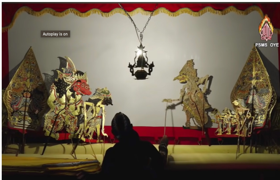
Gambar 1. Gambar Adegan “Petruk Dadi Ratu”

Sumber: Youtube Channel Budaya Nusantara, rekaman live streaming, diakses 30 September 2023.