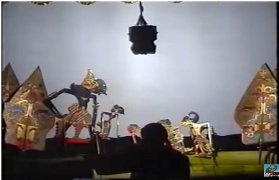
Gambar 2. Adegan “Pandawa Tandhing”

nasionalisme yang disampaikan pada para pejuang untuk bisa ditransformasikan dalam semangat kemerdekaan. Kisah-kisah heroisme seperti “Kresna Gugur”, “Pandawa Moksa”, “Kumbakarna Gugur”, maupun Bima Suci adalah serangkaian lakon yang sering kali digunakan untuk membakar semangat resistensi para pejuang Indonesia (Mawardi, 2009). Adapun dalam zaman kolonialisme Jepang sendiri digunakanlah secara politis, lakon “Pandawa Tandhing” sebagai propaganda Jepang yang mencitrakan dirinya sebagai pandawa sebagai pihak yang “benar” melawan pihak Sekutu yang dianggap sebagai biang kejahatan. Hal tersebut rupanya efektif dalam memengaruhi secara psikologis masyarakat Indonesia terutama kaum pemuda untuk membantu Jepang dalam Perang Asia Timur Raya.