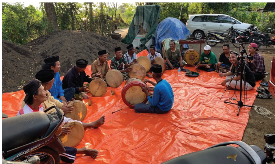
Gambar 2. Terbhâng Ghendhing dalam Konteks Latèyan (latihan) Sumber: Dokumentasi Pribadi

Dalam perkembangannya, terbhâng ghendhing mengadopsi struktur musikal gamelan baik dalam susunan ritmik, bentuk gending, maupun logika dinamika ke dalam format instrumen membran yang terdiri atas 8 instrumen terbhâng ( pettèt budi , tenggo' , dhu' tengnga , dhu' adâ' , panerros , kacèran , lakè'an , dan kendhâng ), 1 instrumen jidur (bedug), kencèr (simbal kecil), dan vokal ( kèjhung ) (Hidayatullah et al., 2024). Alih-alih menggunakan instrumen logam seperti bonang dan saron, para kiai kampung beserta masyarakat Madura di Maron menyusun ulang komposisi gending gamelan tersebut ke dalam medium instrumen membran—yang secara normatif dianggap “halal” dalam banyak pandangan ulama. Perubahan ini tidak sekadar dalam ranah estetis, namun politis dan teologis, ia menjadi medium kompromi antara ekspresi musikal dan tuntutan nilai Islam yang berkembang di lingkungan pesantren dan langgar ( langghâr ).