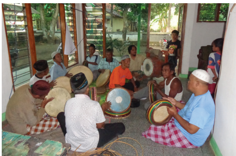
Gambar 3. Rombongan Tunas Muda, pada tanggal 31 Juli 2013