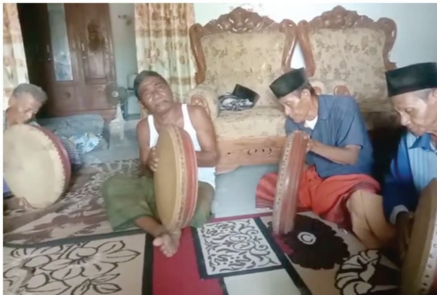
Gambar 4. Musisi Berusia Lanjut (Senior) dalam Latèyan/kompolan

Memasuki periode 1990-an hingga sekarang, perlahan tapi pasti terbhâng ghendhing mulai kehilangan tempatnya. Langgar sudah tidak lagi menjadi aktivitas budaya yang progresif, makin sedikit anak muda yang mau belajar dan beraktivitas ke langgar. Selain itu, makin sedikit pula kiai kampung yang mampu melanjutkan/melestarikan kesenian terbhâng ghendhing —faktanya makin sedikit kiai kampung yang bisa bermain terbhâng ghendhing (Tris, Komunikasi Pribadi, 14 Januari 2023). Generasi muda lebih tertarik pada bentuk musik instan dan hiburan digital. Pergeseran struktur sosial di tanèyan lanjhâng , peningkatan mobilitas kerja, dan munculnya bentuk pertunjukan baru seperti dangdut, organ tunggal, dan sound system hajayan, menyebabkan terbhâng ghendhing kehilangan medan sosial tempat ia tumbuh.