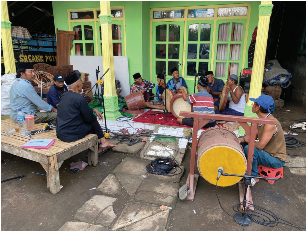
Gambar 1. Terbhâng Ghendhing dalam Konteks Latèyan

Kesenian seperti terbhâng ghendhing menjadi salah satu produk budaya khas dari dinamika ini. Ia bukan sekadar musik hiburan, namun perwujudan nilai Islam lokal dalam bentuk yang ekspresif—melalui tabuhan, syair, dan formasi tubuh yang kolektif. Dalam konteks masyarakat seperti ini, seni tidak bisa dilepaskan dari relasi sosial, struktur komunitas, dan ritual keagamaan, Ia hidup ditopang oleh struktur sosial tanèyang lanjhâng , disemai di ruang langgar, dan dirawat oleh para kiai kampung yang memiliki otoritas spiritual dan kultural sekaligus.