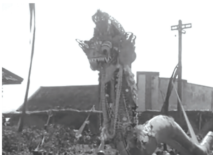
Gambar 4. Upacara Kremasi Dewa Agung Oka Geg 1965

Keberadaan tradisi masatia rambut sebagai pengganti masatia memberi gambaran bahwa terjadi sebuah transformasi dalam tradisi masyarakat Bali. Kedua praktik ini pada dasarnya memiliki substansi yang sama, yakni sebagai bentuk kesetiaan dan pengabdian rakyat kepada rajanya. Meski demikian, pergeseran terjadi dalam konteks pelaksanaannya. Jika pada masatia , pemerintah kolonial menilai tradisi tersebut sebagai paksaan dari pihak kerajaan, maka dalam masatia rambut justru masyarakat yang menginisiasi dan menciptakan gerakannya secara kolektif.