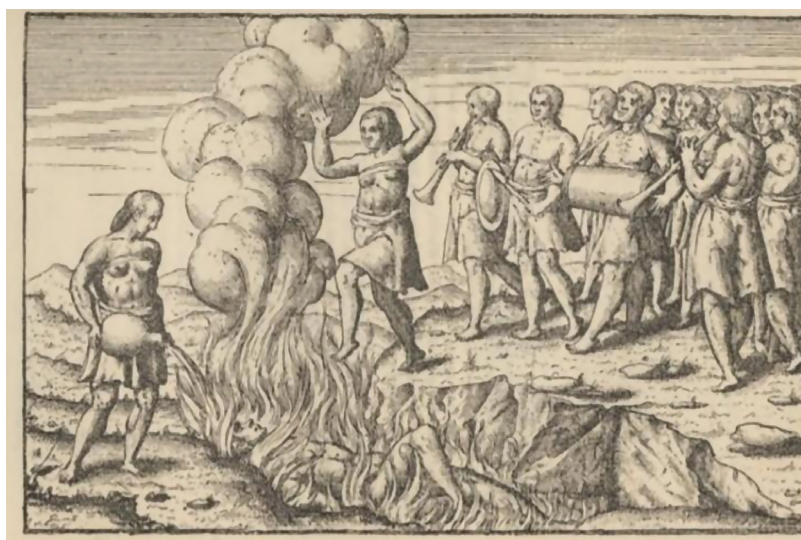
Gambar 1. Ilustrasi kremasi di Bali 1597

Tradisi masatia juga dapat dipahami sebagai hasil penafsiran masyarakat Bali terhadap kisah-kisah kesetiaan istri dalam kakawin (Creese, 2012). Beberapa kisah heroik dalam teks-teks tersebut membentuk pandangan bahwa seorang istri bangsawan berkewajiban untuk masatia . Dalam Kakawin Bharatayuddha diceritakan Satyawati yang menyusul kematian suaminya Salya serta Ksitisundari yang wafat mengikuti Abimanyu. Kisah serupa juga muncul dalam Kakawin Kresnayana melalui Yajnowati yang menyusul Samba, dan dalam Kakawin Krsnantaka ketika seluruh istri Kresna memilih mati bersama suaminya.